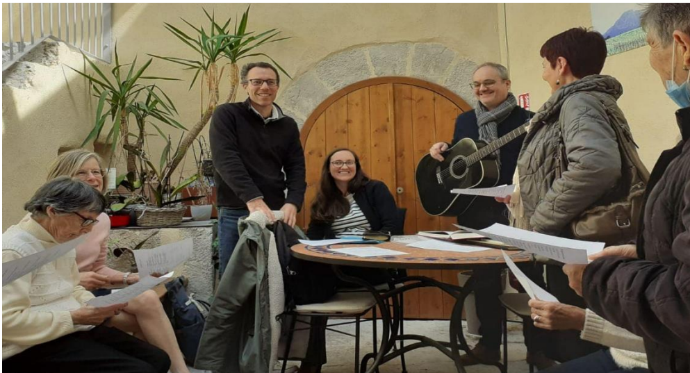
De kleine gemeente van Saint Matthieu de Treviers bedenkt telkens weer nieuwe initiatieven om mensen te bereiken met het Evangelie.

Aan de kerkenraden van de Christelijke Gereformeerde Kerken en Nederlands Gereformeerde Kerken in Nederland en alle particuliere gevers die ons werk steunen.