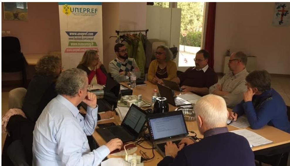
De 'Commission Permanente' (leiding van de UNEPREF) bijeen in één van de kerken van het Franse kerkverband.

Aan de kerkenraden van de Christelijke Gereformeerde Kerken en Nederlands Gereformeerde Kerken in Nederland en alle particuliere gevers die ons werk steunen.