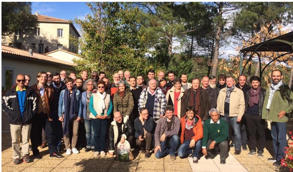
In vertrouwen elkaar bemoedigen en zorgen delen tijdens de jaarlijkse predikantenconferentie van de UNEPREF in Frankrijk.

predikant en dat van zijn gezin. Hoe kunnen zij zelf groeien in hun geestelijke band met God, zodat zij ook anderen daarin weer kunnen helpen? Om het belang van dit thema voor het hele gezin te onderstrepen, zal de conferentie dit jaar ook voor de predikantsgezinnen zijn. Ook echtgenoten en kinderen van de predikant kennen op de geïsoleerde plekken die zij vaak hebben hun eigen uitdagingen en vragen. De bijeenkomst is bedoeld om in vertrouwen zorgen te kunnen delen en om met elkaar bemoedigd te worden. Zo'n weekend voor het hele gezin brengt uiteraard hogere kosten met zich mee. Door een extra gift van 2.000 euro helpen we om dit toch mogelijk te maken.