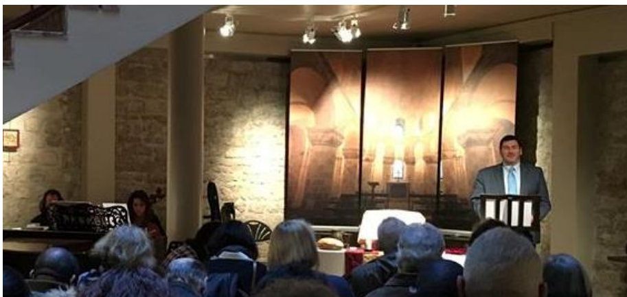
Ds. Samuel Foucachon in de Chapelle de Nesle in Parijs.