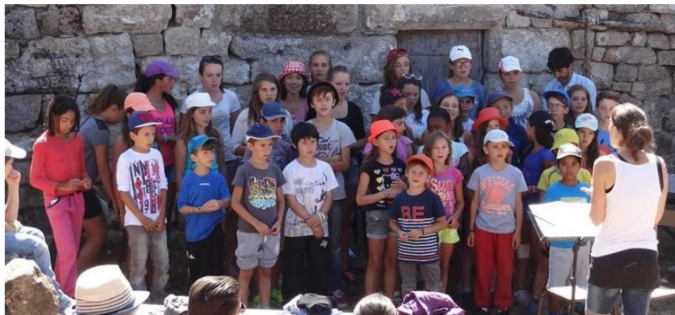
Het Franse kinderkoor Aquarium in actie afgelopen zomer tijdens een zomerkamp in Grizac.

Aan de kerkenraden van de Christelijke Gereformeerde Kerken en Nederlands Gereformeerde Kerken in Nederland en alle particuliere gevers die ons werk steunen.