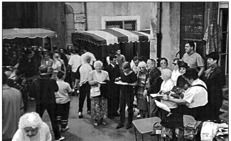
Zingen op straat in Anduze

In het algemeen willen we het belang onderstrepen om in het buitenland op zondag een kerkdienst bij te wonen. Dat is in Frankrijk niet zo eenvoudig vanwege de taalbarrière. Toch kan het kerkbezoek van gasten uit het buitenland voor onze Franse broeders en zuster veel betekenen. We wijzen u nog eens op de mogelijkheid om onze stichting een lijst op te vragen van adressen van de kerken van de Union des Eglises Réformées Evangéliques Indépendantes waar wij als kerken nauw contact mee onderhouden. Daarop staan tevens de aanvangstijden van de kerkdiensten vermeld.