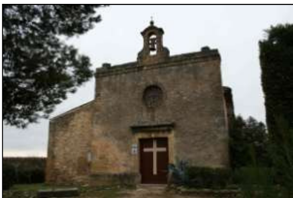
De kerk van Lambesc (ten noordwesten van Aix-en-Provence)

Er zijn nog vijf gemeenten op verschillende plaatsen in Frankrijk, die om een kleine ondersteuning gevraagd hebben voor het uitvoeren van diverse evangelisatieprojecten, die zonder onze steun geen doorgang kunnen vinden. De kerken van Saint-Girons, Plan-du-Cuques en een koor uit diverse kerken vragen elk een bijdrage van € 1.000 voor concerten en voor andere evangelisatieacties, Saint-Hippolyte-du-Fort en Massy ieder € 500 en de gemeente van Lambesc € 200. Het zijn kleinere projecten, maar ze zijn voor deze plaatselijke gemeenten van groot belang. We onderstrepen hoe wezenlijk het is voor hen om te merken dat zij er in Frankrijk niet alleen voor staan.