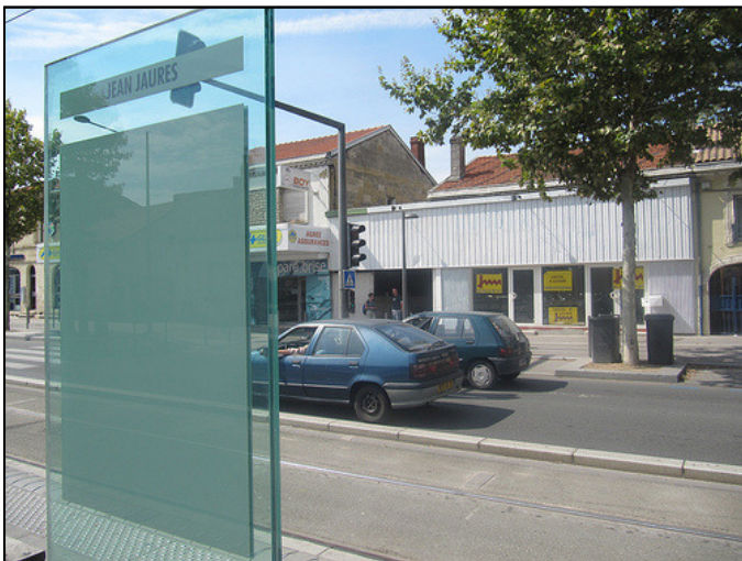
Het nieuwe kerkgebouw in Bordeaux (achter de boom)